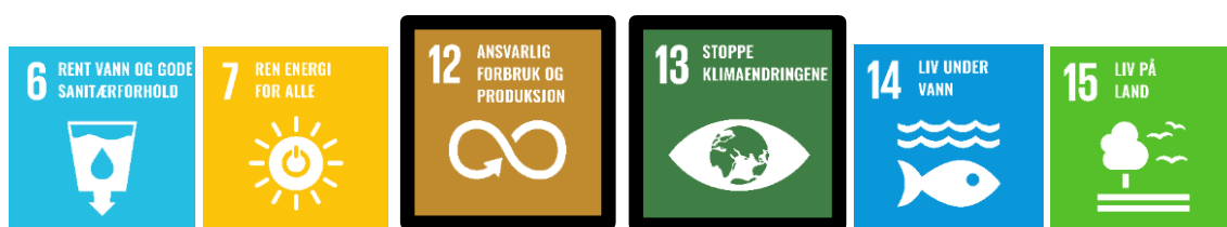
Figur 4. Bærekraftsmål innen Klima- og miljømessig bærekraft.

Gjennom arbeidet med kommuneplanens samfunnsdel har kommunen prioritert å jobbe særskilt med bærekraftsmål 12 Ansvarlig forbruk og produksjon og 13 Stoppe klimaendringene, se figur 4 under.