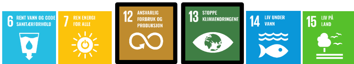
Figur 4. Bærekraftsmål innen Klima- og miljømessig bærekraft.

I arbeidet med planstrategien er det identifisert indikatorer som skal bidra til å belyse hovedutfordringene og gjøre det mulig å følge utviklingen. Disse omtales kort under og kan studeres nøyere i vedlegg 3.