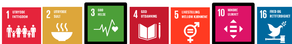
Figur 3. Bærekraftsmål innen sosial bærekraft.

Gjennom arbeidet med kommuneplanens samfunnsdel har kommunen prioritert å jobbe særskilt med bærekraftsmål 3 God helse, og 10 Mindre ulikhet, se figur 3 under. Mennesker trenger en god helse for å kunne yte sitt fulle potensial og for å kunne bidra til å utvikle samfunnet.